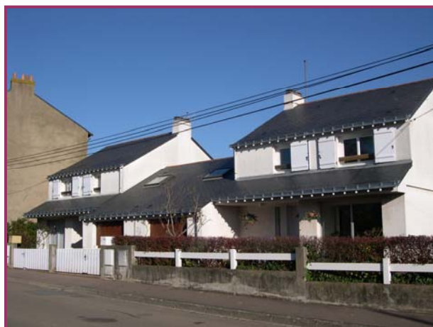
Nantes Rue de la Pâtur