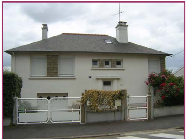
Rennes Lotissement Louis Armand