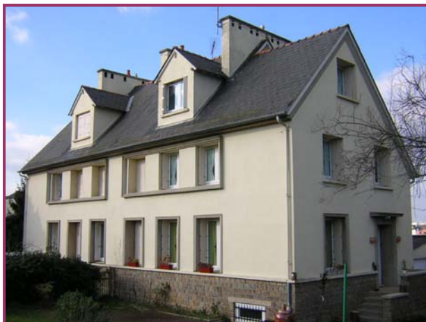
Rennes Rue Auguste