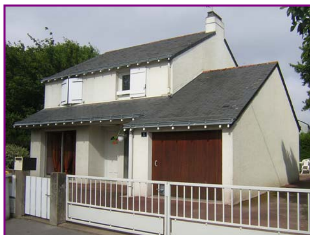
Nantes Rue des Canaries