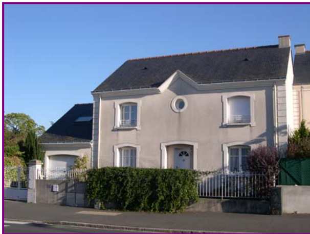
Nantes Rue Landreau