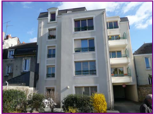
Angers Rue Eblé