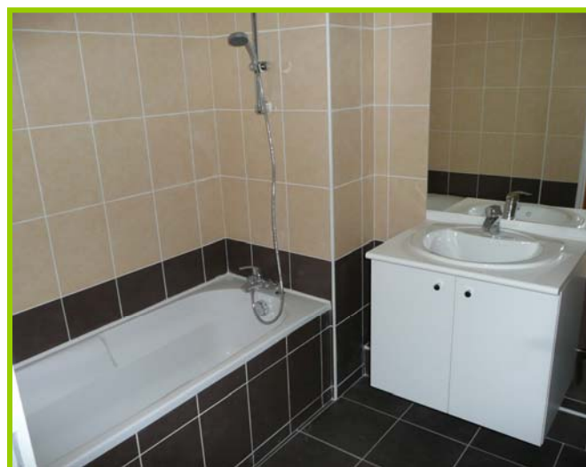
Exemple de salle de bain