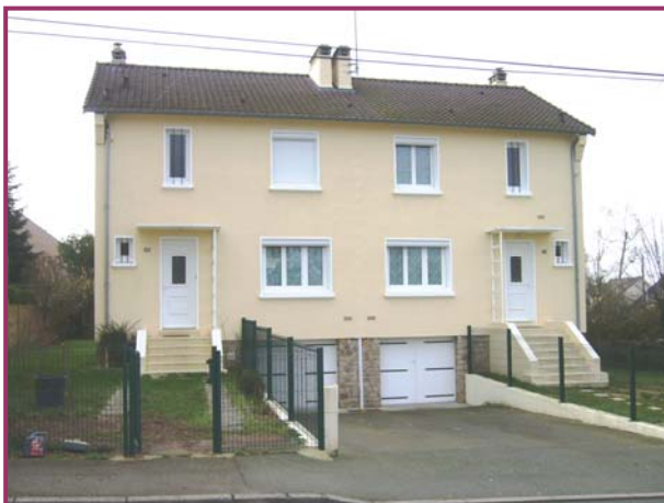
Le Mans Rue du Château d'Eau